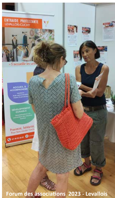
Forum des associations 2023 - Levallois

AG ASSOCIATION ENTRAIDE EPU LEVALLOIS-CLICHY - 10 MARS 2024