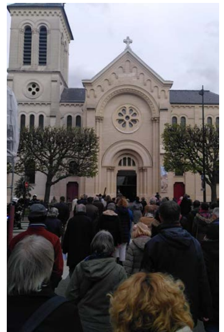
Marche des témoins