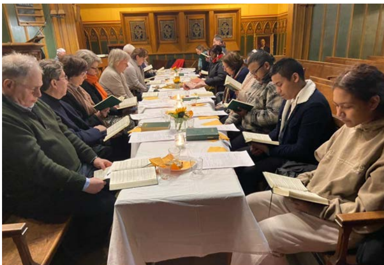
Culte du Jeudi Saint avec Sainte Cène à table