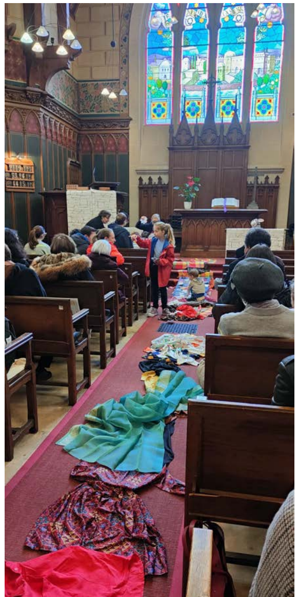
Culte des Rameaux