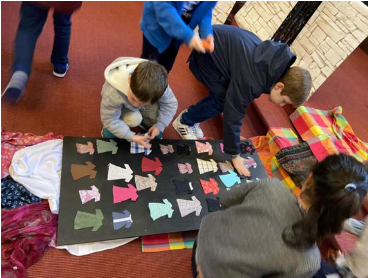
Culte des Rameaux