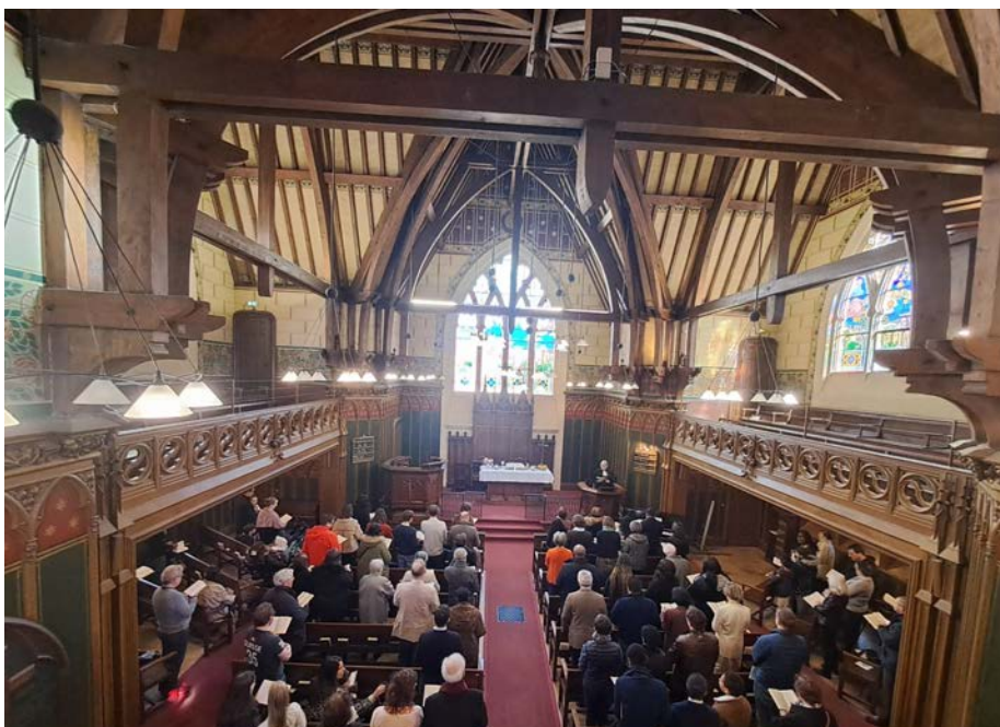
Culte de Pâques