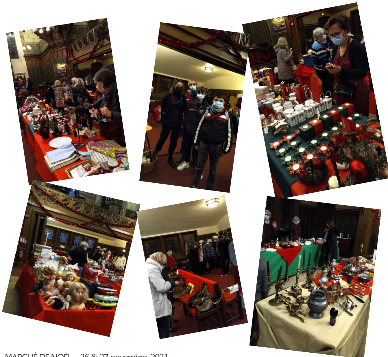
MARCHÉ DE NOËL - 26 & 27 novembre 2021