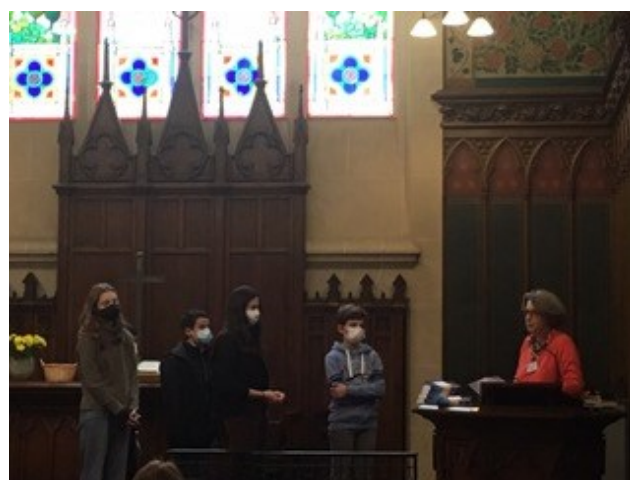
REMISE DES BIBLES AUX CATHÉCUMÈNES - 14 novembre 2021